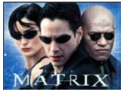
Carrie-Anne Moss, Keanu Reeves y Laurence Fishburne, en “The Matrix” (1999).

THE MATRIX: más allá de la espectacularidad visual (otra vez: la exaltación de los sentidos) Matrix propone alegóricamente lo que planteamos en esta serie de artículos: que la “realidad” no es La Realidad , y que en esa Otra Realidad hay quienes nos explotan a través del Sistema (the matrix). Oh, sí, hasta aparecen nuestros “alter ego”: Neo, Morpheus y los demás. Muy interesante. Sólo que (otra vez) desde el estreno de la película ya me harté de que cada vez que expongo mis tesis ante un público neófito, alguien exclame “ muy Matrix para mi gusto ”, o “ ¡Ah!, ¿algo así como en la película? ”. Nuevamente: por la exageración metafórica y la exaltación de los sentidos, nuestras prolijas tesis “conspiranoicas” quedan ridiculizadas y —de paso— lo que las ridiculiza genera millones (o sea, fortalece el Sistema). Muy conveniente.