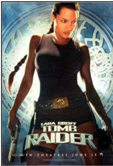
Angelina Jolie, en “Lara Croft: Tomb Raider” (2001).