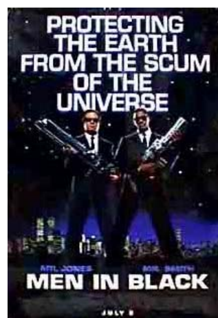
Tommy Lee Jones y Will Smith, en “Men In Black” (1997).

La película “HOMBRES DE NEGRO”: Antes de ella, el tema de los MIBs si bien no era de conocimiento masivo para el público (recuerdo aún en ciertas conferencias antes del estreno de la cinta cuando los asistentes —salvo que estuvieran empapados en estas cuestiones— enarcaban las cejas con sorpresa e interés cuando uno planteaba el tema) tenía una entidad propia: generaba suspicacia, temor o escepticismo, pero todo ello en el marco de un debate racional. Después del estreno (y hago excepción, si me permiten el argentinismo, de quienes “son del palo”, es decir, aquellas personas con conocimiento previo y relativamente profundo de la cuestión), ¿quién se toma con seriedad el