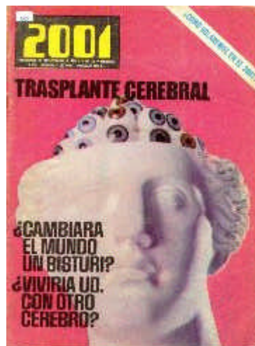
(2001, Nº 10, mayo de 1969)

De los OVNI's sabemos sólo lo que los hechos escuetos, concretos y fríos nos han dejado saber. Aquél que busque la verdad tiene ante sí un verdadero rompecabezas. Sobre la antigüedad existen, sí, indicios, huellas y relatos sugerentes que tornan factible una hipótesis de trabajo. Pero, ahora y aquí, el "fenómeno" tal como lo conocemos se nos escapa y –aunque parezca increíble– siempre surgen vallas, inconvenientes, retrasos, deserciones, que impiden llegar al fondo del problema cuando se plantea concretamente un hecho inusitado. Siempre existen peros, frenos, como si una fuerza superior invisible y superpoderosa actuase sobre los acontecimientos, modificara los planes, quebrase la voluntad del investigador en el momento decisivo o promoviera la reacción del escéptico y el ocultamiento sistemático.